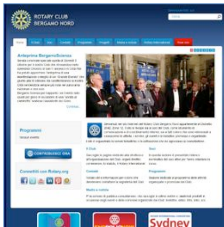
Versione per computer

Ristorante Antica Perosa c/o Starhotels Cristallo Palace Via Betty Ambiveri, 35 - Bergamo