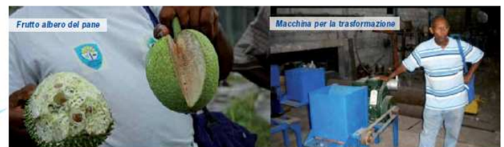
Fruito albero del pane