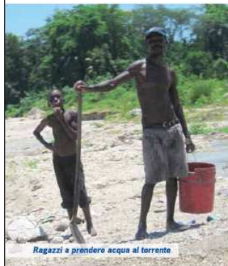
Ragazzi a prendere acqua al torrente

AQUAPLUS è il più grande progetto pluriennale mai realizzato dai rotariani del Distretto 2040. Si propone di realizzare e mettere a punto delle best practice per un utilizzo efficiente dell'acqua, sia per uso potabile che, soprattutto, agricolo.