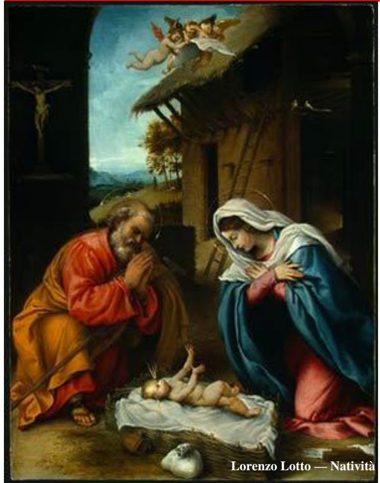
Lorenzo Lotto — Natività

Le opere dell'amore sono sempre opere di pace. Ogni volta che dividerai il tuo amore con gli altri, ti accorgerai della pace che giunge a te e a loro. Dove c'è pace c'è Dio, e' così che Dio riversa pace e gioia nei nostri cuori.